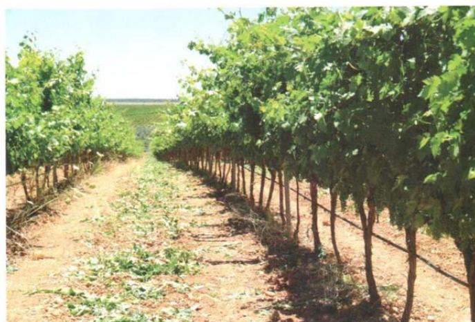
En Marqués de Valdeuz se efectúa un control constante a pie de viña.

Con esta materia prima se elabora el aceite de oliva virgen extra Marqués de Valdeuz. Son las aceitunas más verdes y menos maduras, de menor rendimiento (como hemos visto) y mayor coste. Pero con ellas se logra un aceite de sabor marcado, limpio y complejo. Es un producto de gran recorrido en la cocina. Funciona en crudo, para finalizar platos, en ensaladas, quesos, tostadas, pescados al vapor, verduras o carnes a la plancha. Y también encuentra acomodo en ensaladas de cítricos y verduras al vapor. Incluso algu-