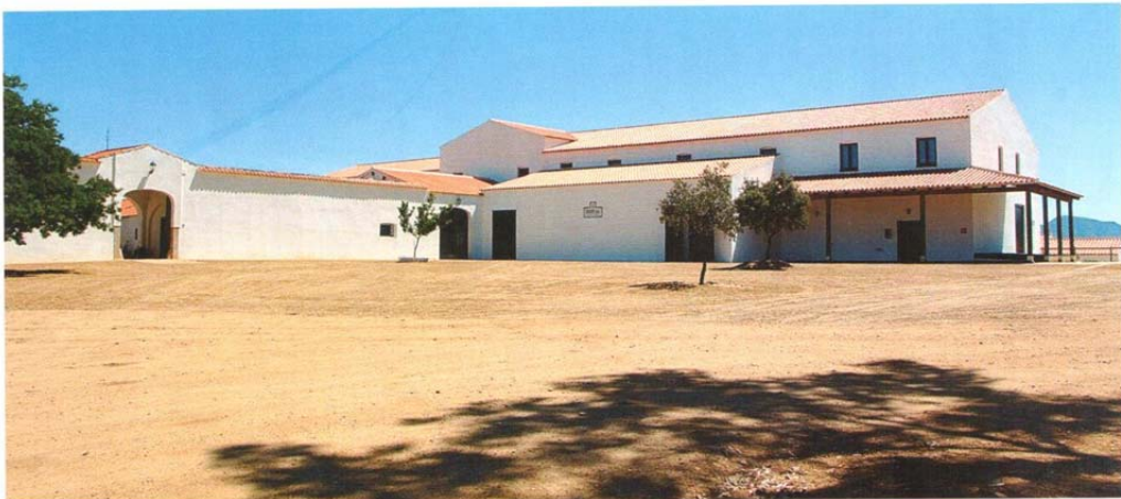
En la finca de Perales de Valdeuza (Mérida) está situado Marqués de Valdeuza.