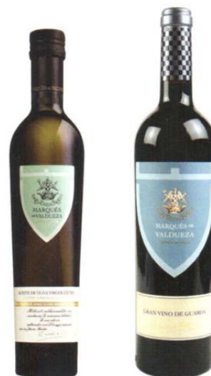
El aceite y el vino de Marqués de Valdeuzza está presente en el Club del Gourmet en El Corte Inglés.

que ha venido proporcionando durante siglos de manera ininterrumpida un aceite de oliva muy codiciado por césares, sultanes y reyes. Pues bien, en estas tierras se reparten las variedades arbequina, hojiblanca, picual y morisca. Esta última es una rareza. Solo se cultiva en una pequeña zona de Extremadura y se caracteriza por un escaso rendimiento. Esta singularidad le da un sabor suave al aceite, resultando básica para su equilibrio. Otra de las claves habita en cómo se elabora el producto. En 2004 se inauguró una nueva almazara, que se levanta sobre un antiguo molino de 150 años, la cual, a su vez, fue erigida en una zona de producción de aceite que los romanos ocuparon hace 2.000