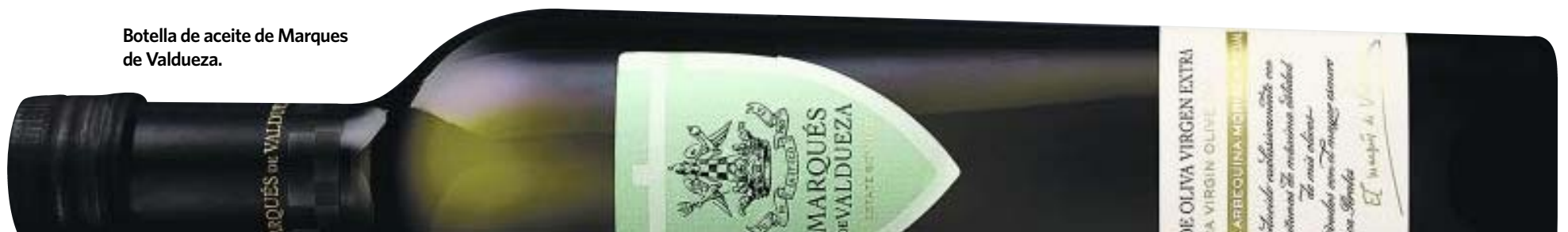
Botella de aceite de Marqués de Valdeza.