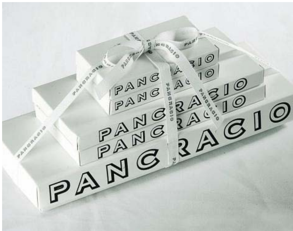
Una ensaimada, típico bollo mallorquín. JUANJO SANTACANA

3. Cacao Sampaka ( www.caosampaka.com ). Cuenta