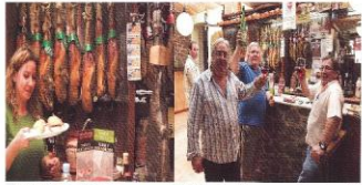
ラ・デエサ・デル・カストロ 博物館の目、バルでにぎやかに乾杯

La Tabaca del Castillo ●D.T.A. 住所: Plaza de España, 10, 06800 Mérida ●営業時間 10:00-20:00 ●予約: 0674 31 1177