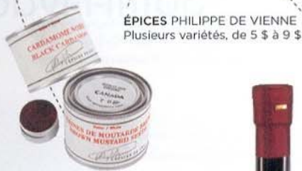
ÉPICES PHILIPPE DE VIENNE Plusieurs variétés, de 5 $ à 9 $