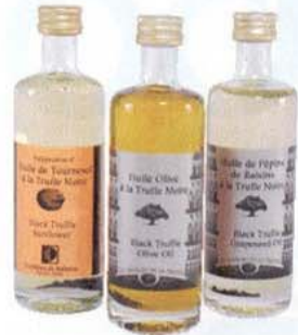
HUILE DE TRUFFE Bien qu'on l'appelle communément « truffe du Périgord », c'est en Provence, terre natale de Truffières de Rabasse, qu'on récolte 80 % de la production française de Tuber melanosporum ! Appelée aussi « truffe noire », c'est la plus savoureuse et la plus parfumée des truffes. La truffe est un champignon souterrain qui vit en symbiose avec certains arbres, comme le chêne. 16,95 $ ch.