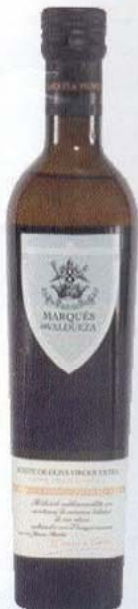
HUILE D'OLIVE EXTRA VIERGE MARQUÉS DE VALDUEZA (500 ml) Cette huile a été sélectionnée parmi les 12 meilleures huiles extras vierges au monde. Faites d'olive Morisca, une variété très rare, elle est cueillie à la main et pressée dans les 45 minutes. Saveur fruitée et aromatique. 21,95 $