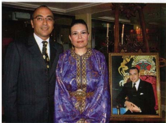
Ambassadörsparet med kungligt porträtt.